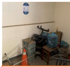
學校地下室當儲藏室，屬偏僻角落，要注意安全