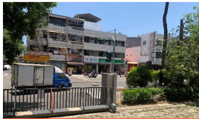
側門綠籬太矮，容易被外人入侵，要注意安全