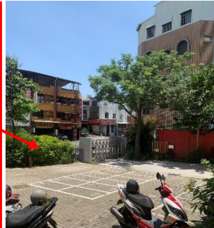
偏僻角落，廚房和施工人員的專用出入口，要注意安全