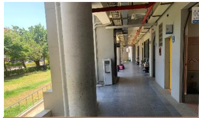
靠近側門的廁所，入侵外人就是躲在這，要注意安全