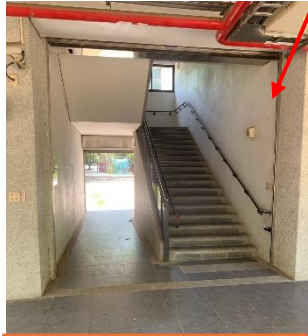
高年級通往風雨球場的通道，常發生學生相撞意外