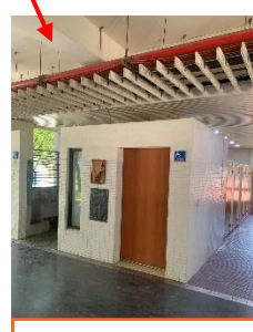
假日校園開放的廁所，也常有外人入侵並逗留，要注意安全