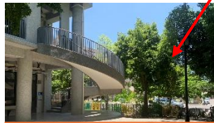
低年級上放學出入口的樓梯，也有斜坡，常發生學生