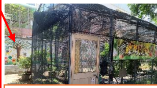
偏僻角落又有通道，曾有學生躲藏在此，要注意安全