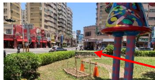
校園偏僻角落，有花圃，學生易摔倒