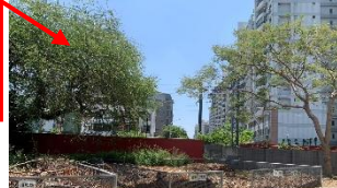
落葉堆肥場，有點深，曾有學生倒落葉倒到跌進去