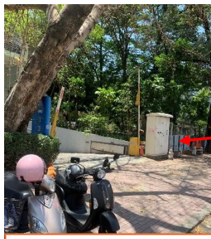
上學通道會經過老師車庫出入口，要注意交通安全