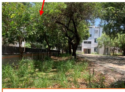
校園偏僻角落的通道，有斜坡，撿球或跑步時不小心會跌落