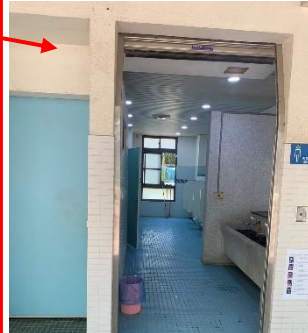
高年級通往操場通道的鄰近廁所，常發生學生相撞意外